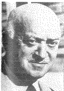
שלמה זלמן שוקן, המו"ל של הארץ מ-1936